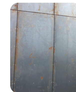
materiál po instalaci

Jednou z možností pro dosažení takového originálního přírodního vzhledu je využití povětrnostně odolné oceli, známé také pod obchodním názvem Corten nebo Atmosfix. Jde o patinující ocel, kde se vlivem korozivních stimulátorů (déšť, vlhkost) vytváří na povrchu pasivační ochranná vrstva, lidově známá jako rez.